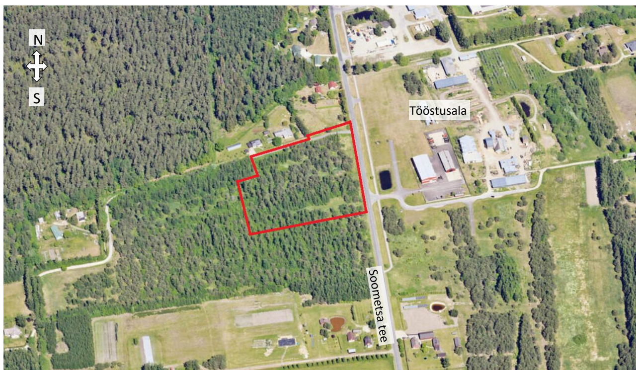
Skeem 1. Vaade planeeringualale lõunast. Planeeringuala on tähistatud punase joonega.

ehitisregistris puudulik, kuid hinnanguliselt on hoonete kõrgus alla 10 m. Planeeringuala paiknemist mõjualas illustreerib skeem 1.